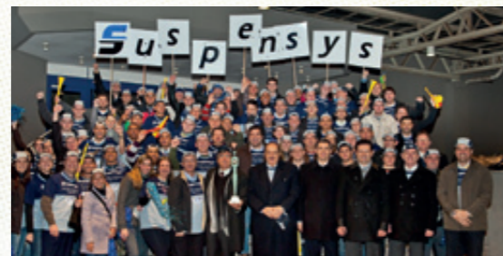
Equipe da Suspensys comemorando o Troféu Diamante

“Trabalhamos para que as nossas soluções sejam criativas, duradouras e justas, em todas as áreas, com o objetivo de melhorar a qualidade de vida de todos. Os avanços devem ser sustentáveis; a melhoria deve ser encarada como uma jornada sem fim. Todo dia é dia de melhorar. Todo dia surge uma nova oportunidade de evolução”, conclui.