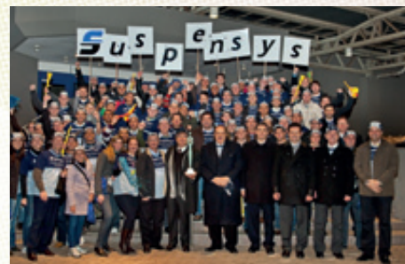
Equipe da Suspensys comemorando o Troféu Diamante

uma jornada sem fim. Todo dia é dia de melhorar. Todo dia surge uma nova oportunidade de evolução”, conclui.