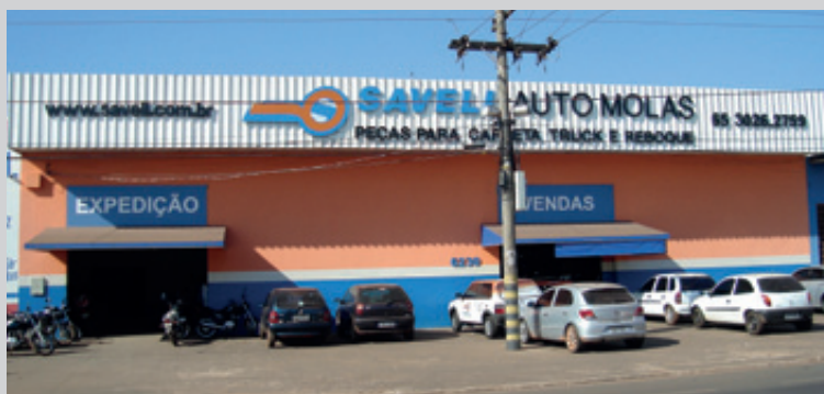
Loja da Várzea Grande, no Jardim dos Estados. Av. Governador Júlio Campos, 6230 – Fone: (65) 3026-2759